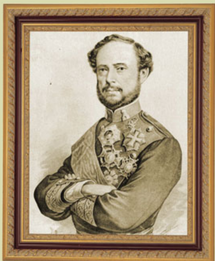
General Juan Prim, Conde de Reus y marqués de los Castillejo, siglo XIX, Fotomecánico, Acervo INEHRM.

Siguiendo la recomendación de Jesús Terán, el gobierno de la República adoptó los principios que se constituyeron en la Doctrina Juárez, que declaró insubsistentes los tratados firmados con naciones que hubieran reconocido al Imperio.