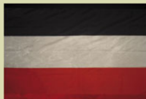
Bandera alemana, 1871.