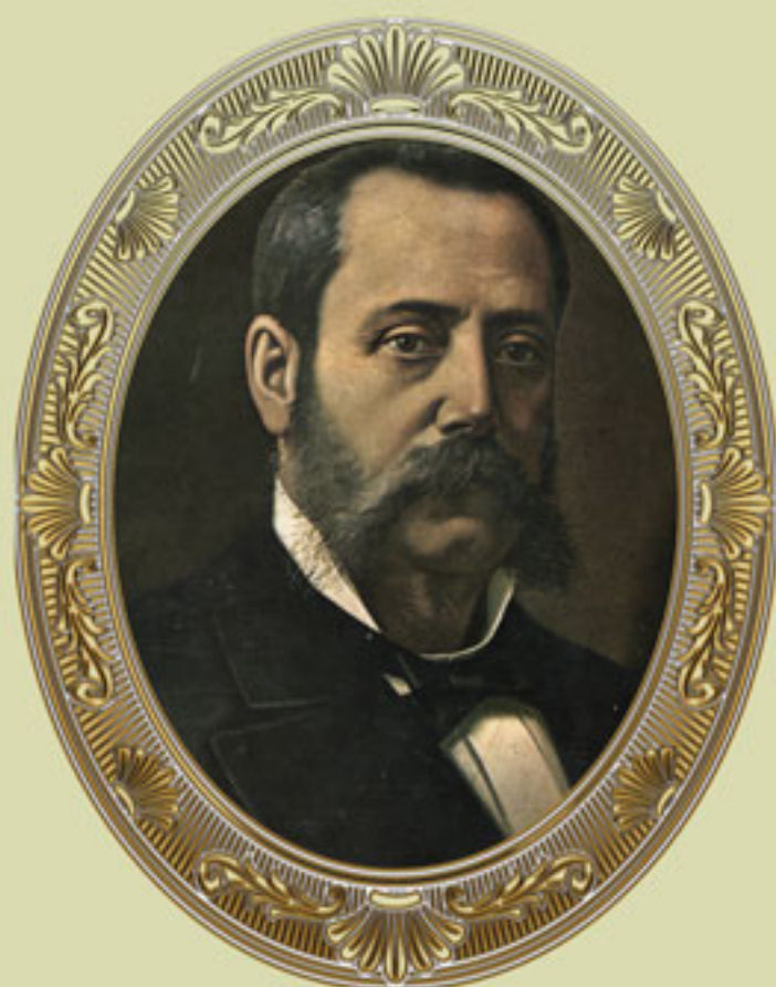
Gabino Barreda, óleo de Juan Cordero.

Ley Orgánica de la Instrucción pública en el Distrito Federal, 2 de diciembre de 1867.