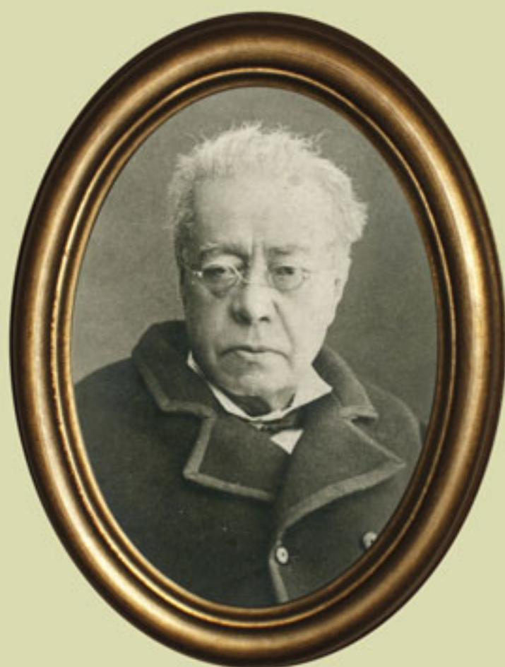
Manuel Orozco y Berra, Archivo Gráfico de El Nacional , Fondo Personales, sobre 2246. INEHRM.