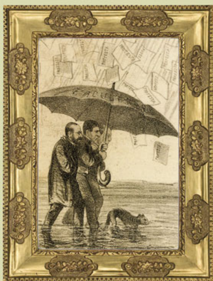
“No hay que fiar de Dios en tiempos de aguas”, La Orquesta , 31 de agosto de 1867.

Sin un enemigo común, las diferencias ideológicas y generacionales dividieron a los liberales. El presidente Juárez no logró que se aprobaran las reformas constitucionales, por lo que tuvo que recurrir a las facultades extraordinarias y la suspensión de garantías constitucionales cuando las circunstancias lo requirieron.