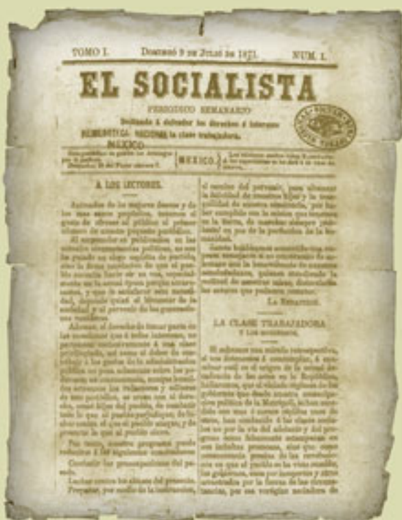
El Socialista, 9 de julio de 1871, Hemeroteca Nacional Digital.

Hacia 1870, la población nacional se aproximaba a los nueve millones de mexicanos, la mayoría establecidos en las zonas rurales y por ello marginados de las actividades políticas, culturales, educativas y económicas del país. Además, el número de habitantes resultaba muy reducido en relación con la extensión del territorio, lo que era un obstáculo para el desarrollo nacional.