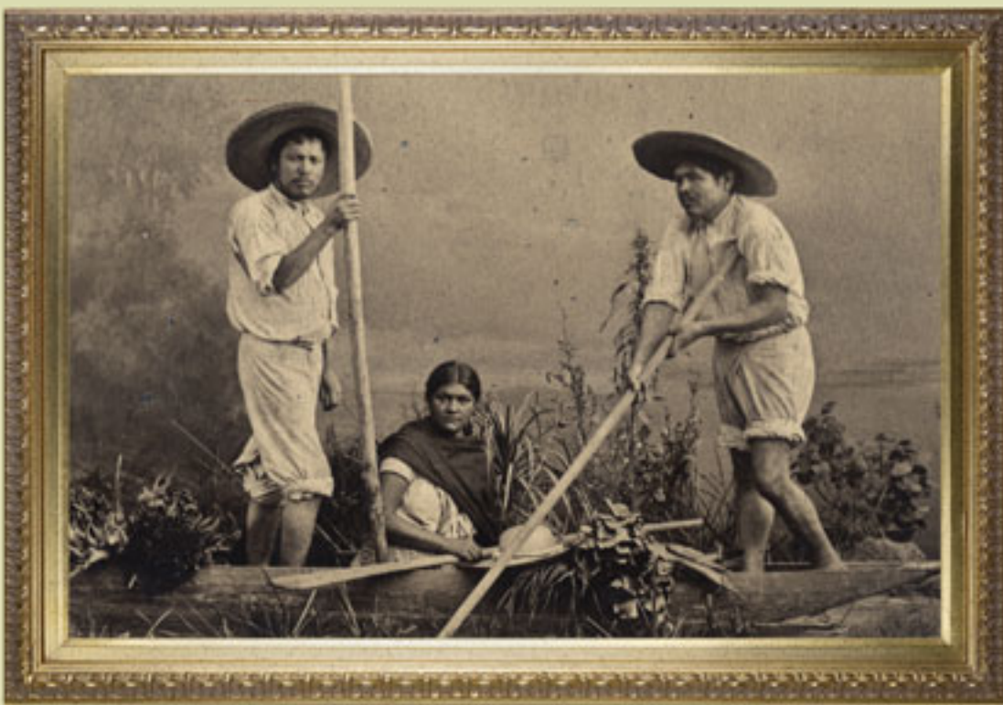
Trajinera en el canal de Santa Anita, Antíoco Cruces y Luis Campa, México, Secretaría de Cultura-INAH-Sinafo-FN.

el derecho de tomar parte en las cuestiones que a todos interesan, no pertenece exclusivamente a una clase privilegiada, así como el deber de contribuir a los gastos de la administración pública no pesa solamente sobre los poderosos[...]