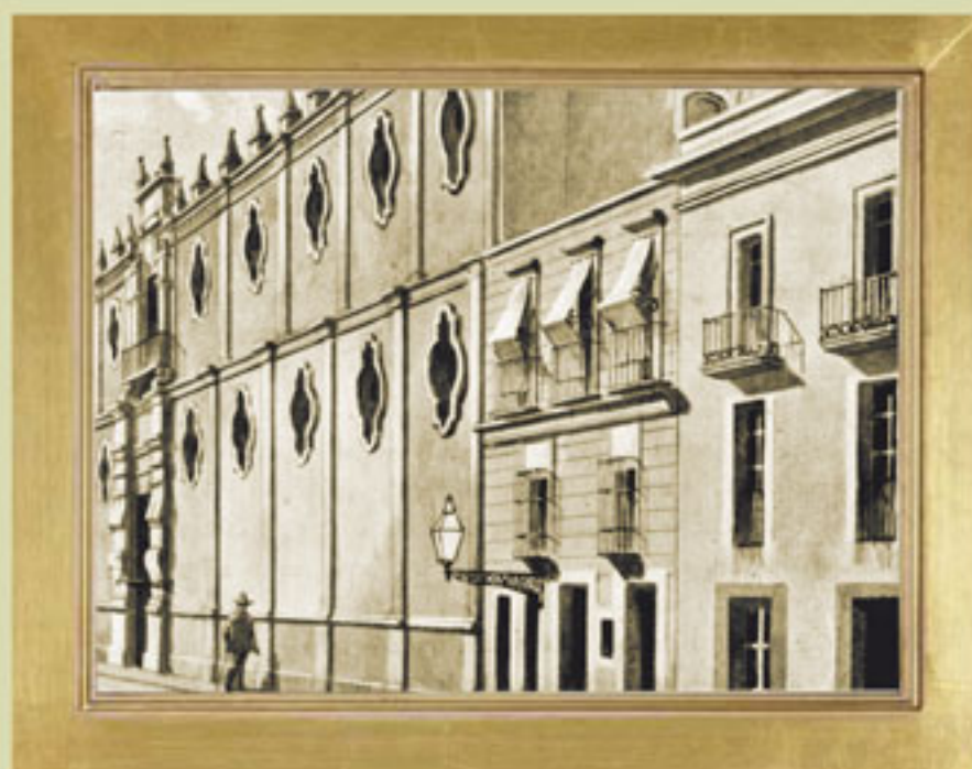
Colegio de San Idelfonso, vista antigua, litografía, siglo XIX.

La reforma a la ley en 1869 estableció la laicidad de la educación y tuvo el objetivo de crear un número suficiente de escuelas primarias para niños y niñas. Así, las 1 424 escuelas primarias existentes en el Distrito Federal en 1857, pasaron a 4 570 en 1869 y 8 103 para 1874. Se crearon también varios institutos de educación superior, como las escuelas de Jurisprudencia, Medicina, Agricultura, Ingeniería y otras, con las que en 1910 se fundó la Universidad Nacional de México.