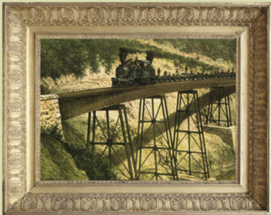
Ferrocarril mexicano, litografía de Casimiro Castro, impresa por H. Iriarte, México, 1868. Fotomecánico, Acervo INEHRM.

Las medidas adoptadas resolvieron muchos de los principales problemas, aunque resultaron insuficientes ante los elevados gastos de la pacificación.