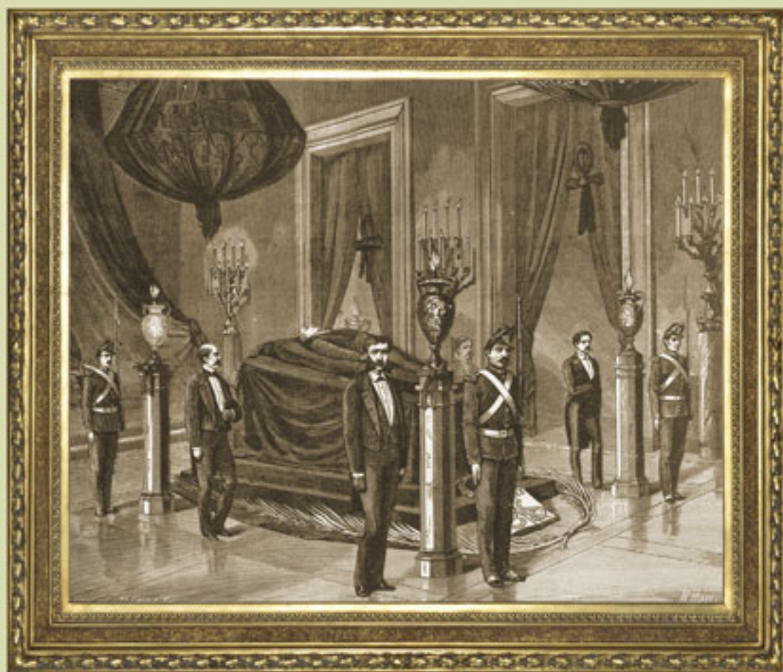
Capilla ardiente de Juárez en el Salón de embajadores de Palacio Nacional, ca. 1872. L. Dumont y H. Meyer, grabado.

El 18 de julio de 1872, víctima de un padecimiento cardíaco, murió el presidente Benito Juárez, indígena oaxaqueño y gran estadista que gobernó a México en los momentos más aciagos de su historia, que promulgó las Leyes de Reforma. Símbolo de la defensa de la soberanía nacional, de la laicidad del Estado y reivindicador de la raza sometida.