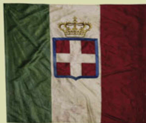
Bandera italiana, 1861-1946.