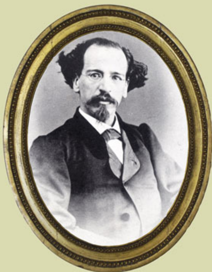
Juan Antonio Mateos, 1867, "Tarjeta de visita", Archivo Documental del Museo Nacional de Historia en el Castillo de Chapultepec.

A partir de la Reforma se cultivó menos el arte religioso y las Bellas Artes pudieron abordar nuevas temáticas con mayor libertad. El triunfo de la República dio impulso y sustento a un nuevo sentimiento nacionalista que fue fuente de inspiración para los creadores, en especial en la literatura, que casi de inmediato produjo obras clave como Calvario y Tabor de Vicente Riva Palacio, El Cerro de las Campanas de Juan A. Mateos, así como innumerables piezas teatrales.