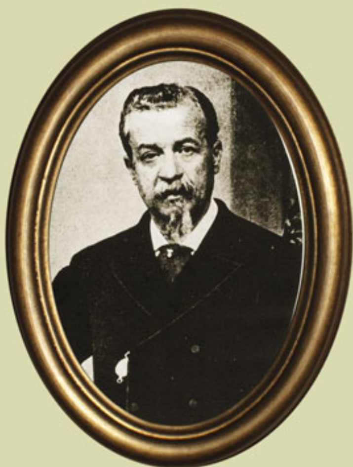
Manuel Dublán Grabado, siglo XIX. Fotomecánico Acervo INEHRM.

Francisco Zarco, 8 de diciembre de 1867.