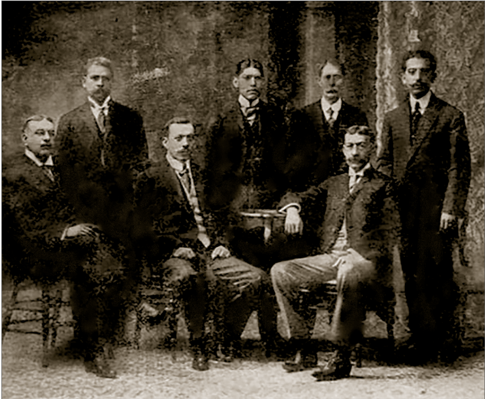
Tomo I, mayo y junio de 1911, Boletín de la Sociedad Indianista Mexicana , Fondo Juan Comas, Biblioteca Juan Comas-Instituto de Investigaciones Antropológicas, UNAM (BJC-IIA)

“Junta Directiva, Sociedad Indianista Jalisciense”