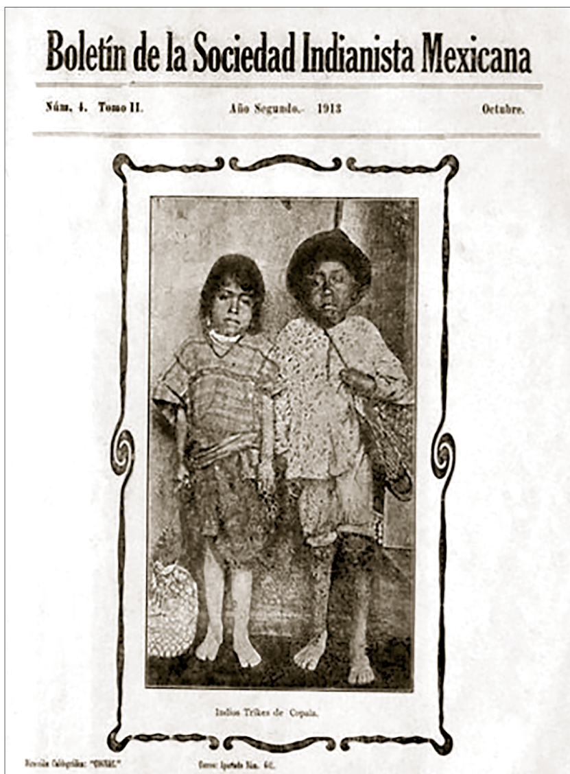
Tomo II, octubre 1913, Boletín de la Sociedad Indianista Mexicana, Fondo Juan Comas, Biblioteca Juan Comas-Instituto de Investigaciones Antropológicas, UNAM (BJC-IIA)