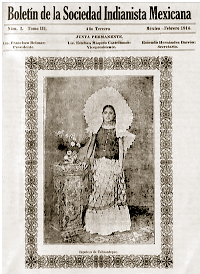
Tomo III, febrero 1914, Boletín de la Sociedad Indianista Mexicana , Fondo Juan Comas, Biblioteca Juan Comas-Instituto de Investigaciones Antropológicas, UNAM (BJC-IIA)