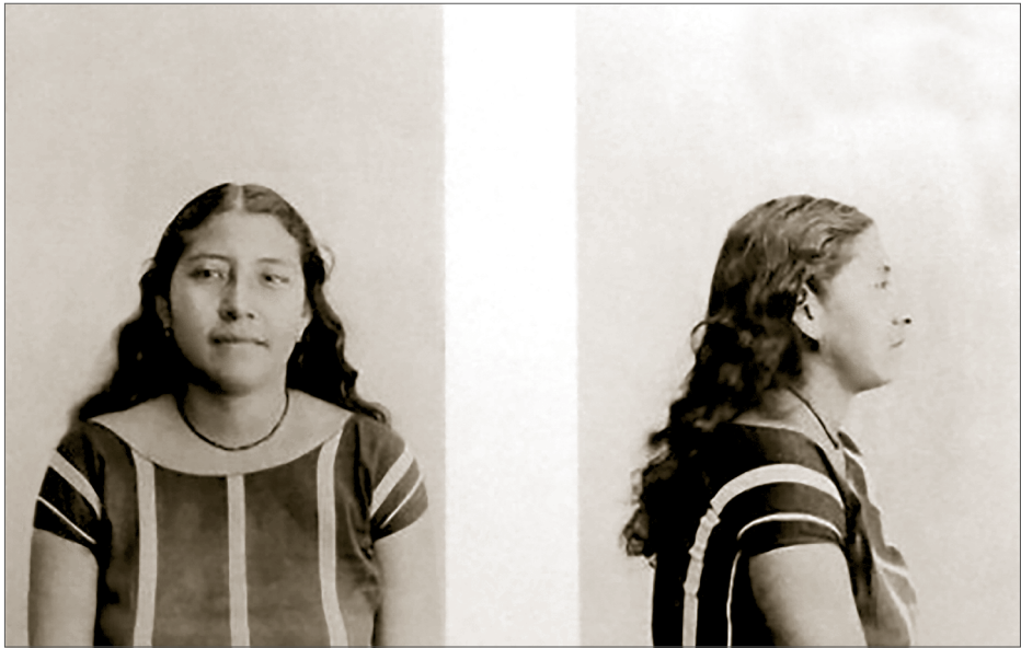
Frederick Starr, 1899, Indians of Southern Mexico , Biblioteca Juan Rulfo, Comisión Nacional para el Desarrollo de los Pueblos Indígenas (CDI).

Sin embargo, la materialización de un cuerpo “indígena” a través de diversas tecnologías no fue un proceso definido en su totalidad por el antropólogo decimonónico. La producción de estas representaciones implicó